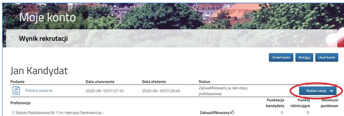
Rysunek nr 1

Po ogłoszeniu wyników kwalifikacji rodzice/opiekunowie dzieci zakwalifikowanych będą mogli złożyć potwierdzenie woli przyjęcia elektronicznie - dotyczy tylko wniosków . W tym celu należy zalogować się na konto, następnie przy wniosku dziecka zakwalifikowanego (status zakwalifikowany w danej rekrutacji), kliknąć przycisk Wybierz akcję (Rysunek nr 1).