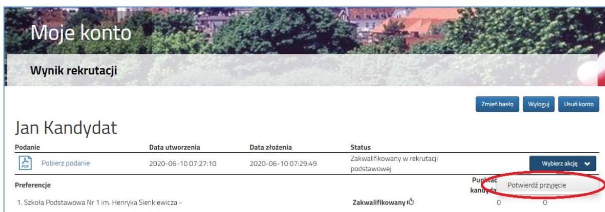
Rysunek nr 2

W kolejnym kroku należy wybrać opcję Potwierdź przyjęcie (Rysunek nr 2).