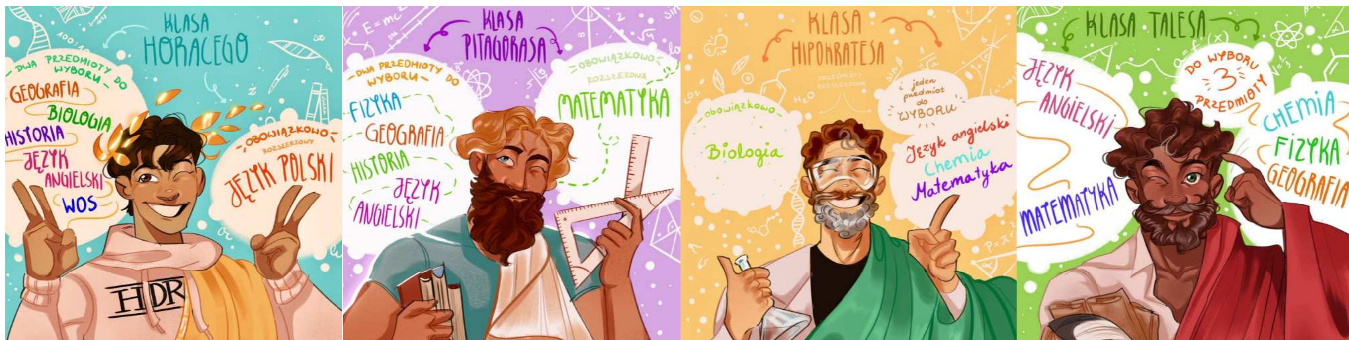
A - klasa Horacego